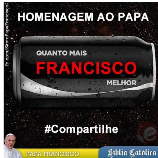
Figura 1 - Post de la página "Papa Francisco I" en Facebook

En ese caso, la página brasileña de Facebook intitulada Papa Francisco I 5 , vinculada a la tradición católica, pero no oficialmente (o sea, no está vinculada a alguna instancia jerárquica de la Iglesia) 6 , publica un "Homenaje al Papa", con una imagen de una lata de gaseosa con la frase "Cuanto más Francisco mejor". La imagen remite a la gaseosa Coca-Cola Zero y a la publicidad que circuló en Brasil que utilizaba el slogan "Quanto mais zero melhor" ("Cuanto más cero mejor"). La imagen, además, propone la invitación en formato de hashtag que dice "#Comparte".